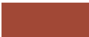
Tile Red 637