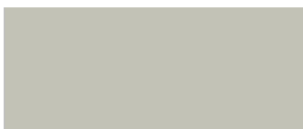
Yellow Grey 217