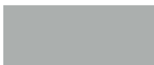
Goosewing Grey 222