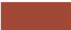
Tile Red 637