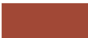
Tile Red 637