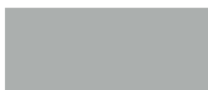
Goosewing Grey 222