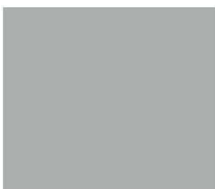
Goosewing Grey 222