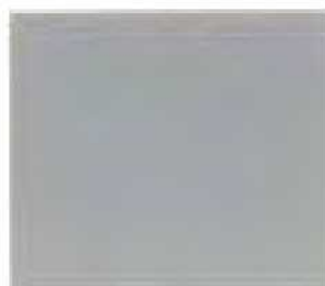
Signal Grey (near to RAL 7004)