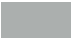
Goosewing Grey 222