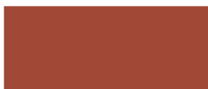
Tile Red 637