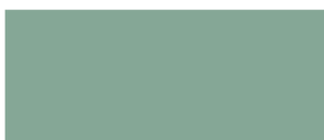
Emerald Green 740